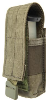
ŁADOWNICA PISTOLETOWA NA 1 MAGAZYNEK KT-02