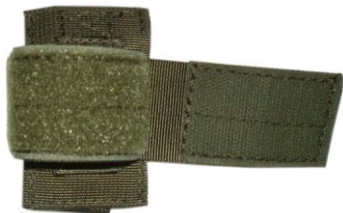
UCHWYT NA LATARKĘ / PAŁKĘ WIELOFUNKCYJNA