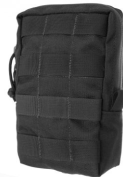
KIESZEŃ CARGO OPERATOR (ŚREDNIA)