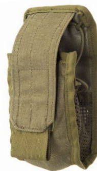
KIESZEŃ NA GPS Z SIATKĄ