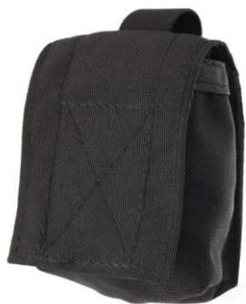
KIESZEŃ NA KAJDANKI KT-02