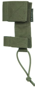
UCHWYT NA BAGNET