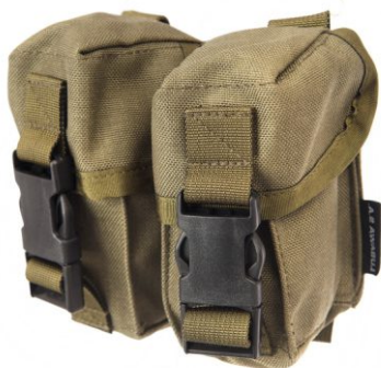
ŁADOWNICA NA 2 GRANATY