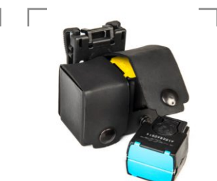
ŁADOWNICA NA KARTRIDŻE