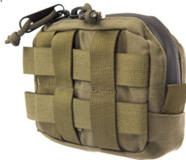
KIESZEŃ CARGO „L”