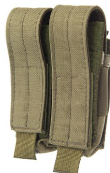
ŁADOWNICA PISTOLETOWA NA 2 MAGAZYNKI KT-02