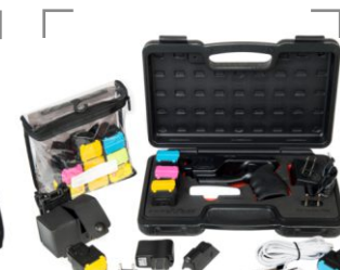
PARALIZATOR + AKCESORIA