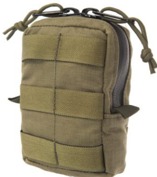
KIESZEŃ CARGO „U”