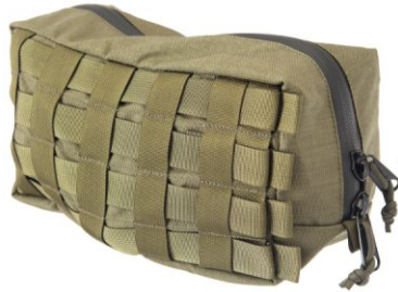
TORBA NA MASKĘ PRZECIWGAZOWĄ MP-5