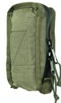
KIESZEŃ NA GPS Z ZAMKIEM