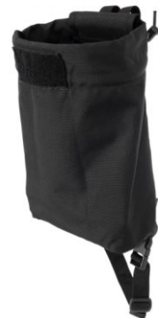
WOREK NA ODZYSK OPERATOR