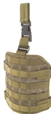
PANEL UDOWY KT-02