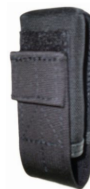
KIESZEŃ NA GAZ