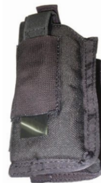
KIESZEŃ NA TASER X-26 OPERATOR