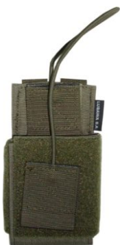
KIESZEŃ NA RADIO REGULOWANA / UNIWERSALNA