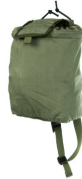
WOREK NA ODZYSK RECCON