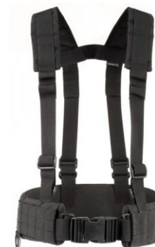
PAS BALISTYCZNY MODUŁOWY + SZELKI PŁASKIE ROZMIAR L