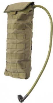
POKROWIEC NA BURŁAK 3 L