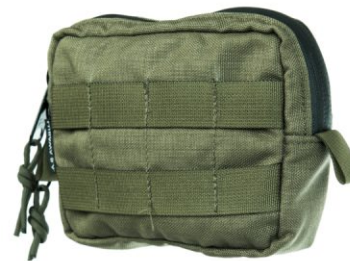
ZASOBNIK MAŁY 12 X 16 X 5