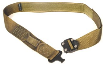
PAS RATUNKOWY (EWAKUACYJNY)