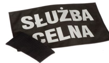
EMBLEMATY (TEKST ZGODNY Z ŻYCZENIEM KLIENTA)