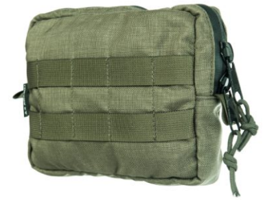
ZASOBNIK DUŻY WYMIARY: 160 X 200