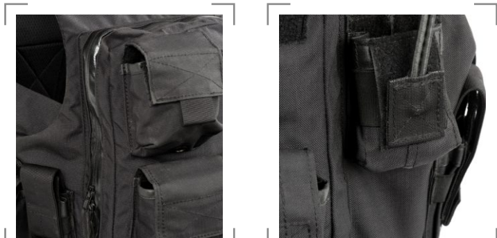
ROZMIAR OBWÓD W PASIE (CM) WZROST (CM) OBWÓD KŁATKI PIERSIOWEJ (CM)