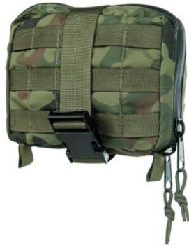
APTECZKA ZASOBNIK DUŻY 160 X 200