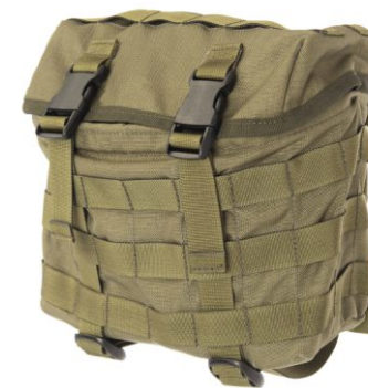
KIESZEŃ CARGO Z KOMPRESJĄ