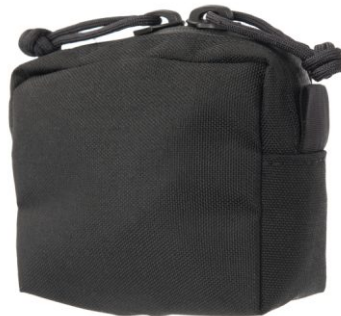
KIESZEŃ CARGO OPERATOR (MAŁA)